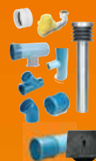
Géoventilation puits canadien