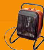
Chauffage industriel et tertiaire

Unelvent • ZI - 66300 Thuir • 04 68 53 02 60