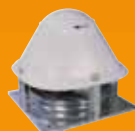
Tertiaire confort et désenfumage