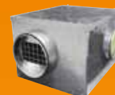
VMC collective et tertiaire