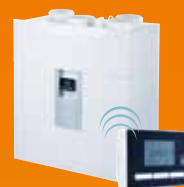
VMC Double flux haut rendement