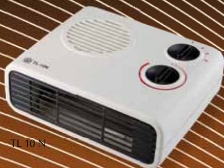
TL 10 N