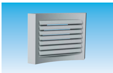
Installation plafond - TMP Ailettes inclinées