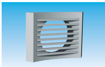
Installation murale - TMM Ailettes horizontales