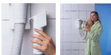
Mise en marche et arrêt automatique par simple décrochage de la buse