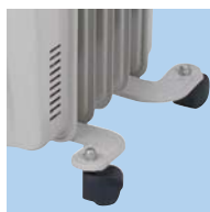
Roulettes de transport multidirectionnelles