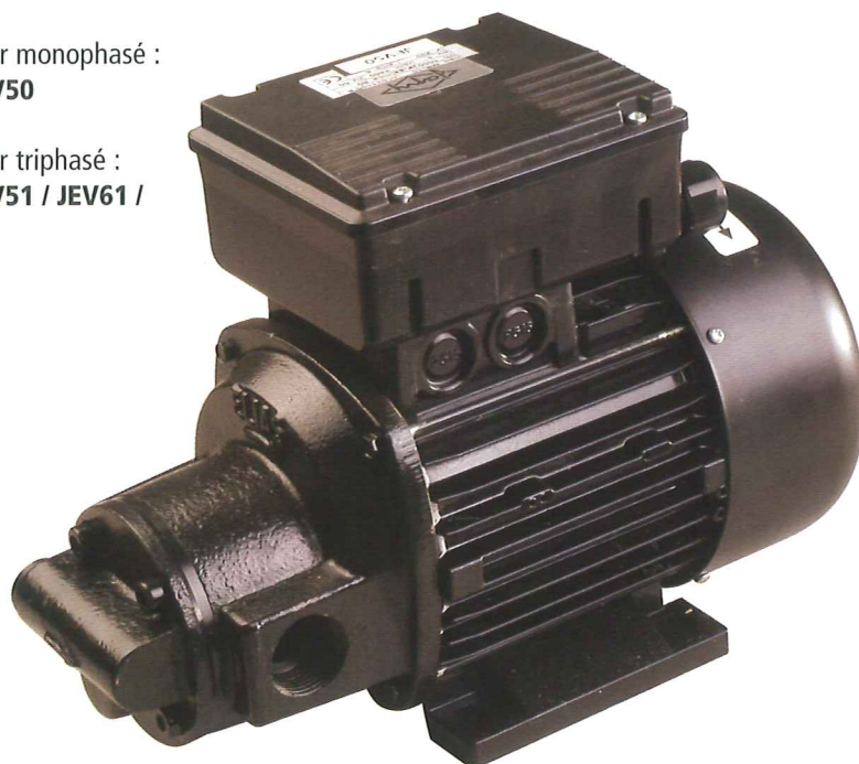
JEV50 moteur monophasé

Pompes avec moteur triphasé : JEV31 / JEV41 / JEV51 / JEV61 / JEV71 / JEV81