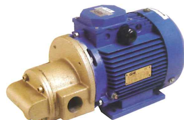
JEV71 moteur triphasé