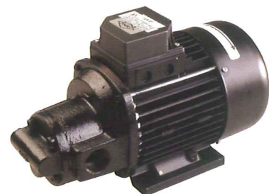
JEV51 moteur triphasé