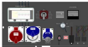
Tableau de contrôle triphasé